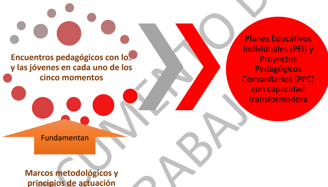
Gráfico 3. Fundamentos del proceso metodológico durante el Impulso 3

En este sentido, se tienen en cuenta, por un lado, marcos metodológicos y principios que orientan la acción pedagógica. Ambos sugieren alineaciones de carácter ético, y si se quiere, estético para el abordaje metodológico de cada momento hacia la construcción del Plan Educativo Individual (PEI) y al Proyecto Pedagógico Comunitario (PPC). Así lo indica la Gráfico 3: