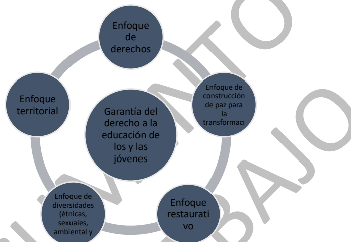
Gráfico 1. Interrelación de los enfoques en el componente educativo

Este apartado tiene como propósito situar algunos conceptos, enfoques y marcos pedagógicos capaces de guiar los procesos de planeación, diseño e implementación para el componente educativo del programa Jóvenes en Paz. En correspondencia con el objetivo de garantizar el derecho a la educación como elemento inapelable para la superación de la desigualdad y la construcción de la equidad, los conceptos devienen de un marco compuesto por una serie de enfoques que dan cuenta de la comprensión, conocimiento y dignificación de los territorios, de sus comunidades, y particularmente, de los y las jóvenes. Los cinco enfoques que se ilustran en la siguiente gráfica tienen carácter interdependiente; es decir, aunque tienen su propio lugar de definición, su implementación a lo largo de toda la propuesta, exige su articulación permanente: